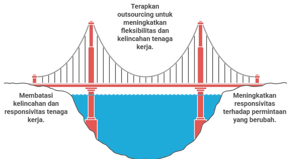
Gambar 1. Mengatasi Fleksibilitas Tenaga Kerja Melalui Outsourcing