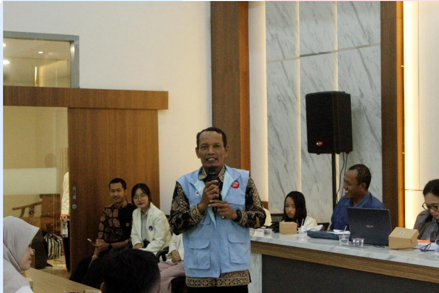
Gambar 3.6 Nara Sumber Inspektorat Daerah kota Salatiga

Sesi game anti korupsi. Ada 6 jenis game. Semai (Sembilan nilai), Majo Junior, Majo, Put-put LK, Arisan, Trata. Peserta di bagi dalam 6 kelompok. Setiap game diikuti oleh 12 – 13 orang peserta dengan 2 atau tiga tutor-fasilitator. Dimana tutor 1 bertugas: