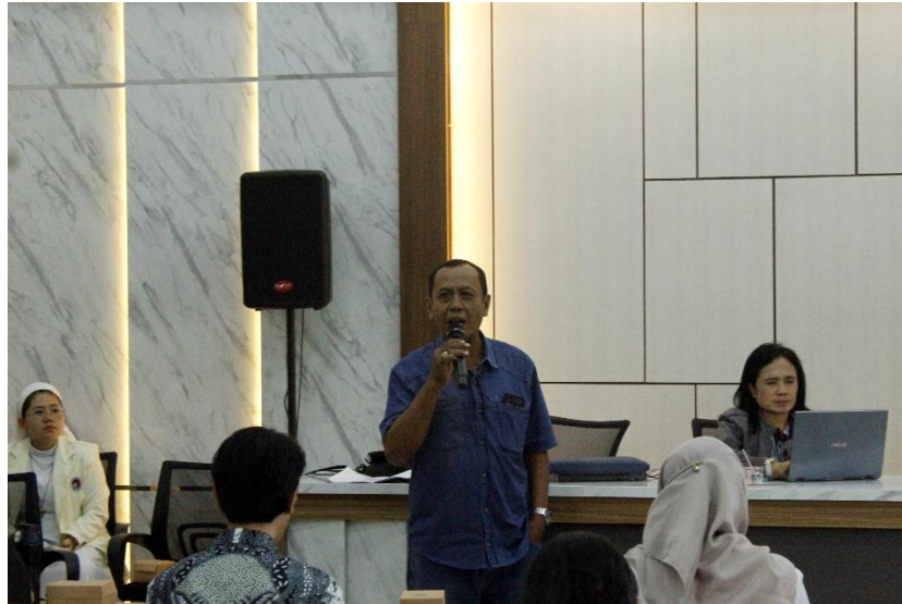
Gambar 3.4 Pembekalan Materi Korupsi-Anti Korupsi