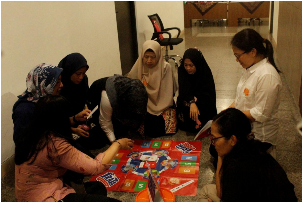
Gambar 3.10 Foto Game Trata

Jawaban, apa yang dilakukan kepala desa tadi terjadi di tahap perencanaan, dengan keluaran RPJMDesa dan RKPDesa. Penyusunan kedua dokumen itu menurut Pasal 80 UU No. 6 tahun 20014 tentang desa harus melibatkan warga desa melalui musyawarah perencanaan pembangunan desa. Apabila dilakukan tanpa mempertimbangkan kebutuhan riil masyarakat, dikhawatirkan akan menyebabkan kegiatan / pembangunan yang dilaksanakan tidak sesuai dengan kebutuhan warga desa.