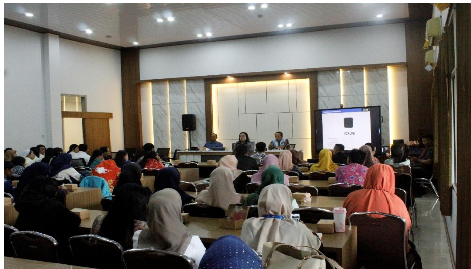
Gambar 3.5 Peserta PAK Guru-guru se-Salatiga dan Sekitarnya