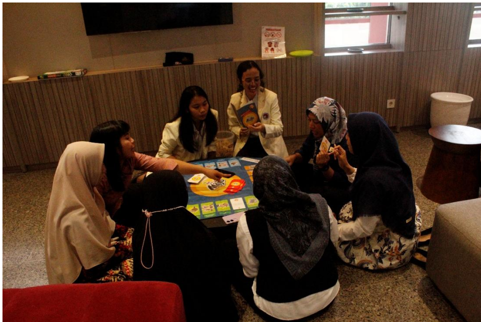
Gambar 3.9 Foto Game Majo

Game dengan beberan , ada kartu, merah dan putih, yang berisi pertanyaan-pertanyaan. Saya seringkali terlibat dalam lelang. Saya tidak pernah bertemu atau menerima pemberian apapun dari peserta lelang, sebelum pemenang diumumkan. Namun biasanya pemenang lelang atas inisiatif sendiri memberikan voucher belanja, voucher hotel atau voucher restoran. Saya menerima karena proses lelang sudah selesai. Pertanyaan ini jawabannya adalah GRATIFIKASI. merah apakah menggunakan mobil dinas untuk kepentingan pribadi seperti belanja ke pasar pertokoan, antar anak ke sekaolah termasuk dalam ranah korupsi?