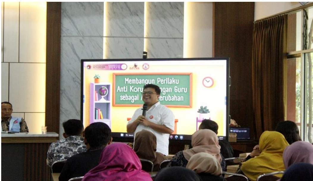
Gambar 1.1 Pemberian Materi Anti Korupsi

Penggerak anti korupsi di sekolah ada dua. Yang pertama system yang kedua penggerak sistem yaitu guru yang berhadapan langsung dengan generasi muda-siswa. Sistem yang salah satunya adalah kurikulum. Sekolah mesti memiliki kurikulum pendidikan antikorupsi. Guru mesti memiliki pemahaman tentang anti korupsi dan mengenal metode-metode anti korupsi, agar sekolahnya bisa mengenalkan anti korupsi secara berkesinambungan dan konsisten, kontinyu. Untuk itulah pengabdian masyarakat mengenai Pendidikan Anti Korupsi Untuk Guru merupakan langkah strategis.