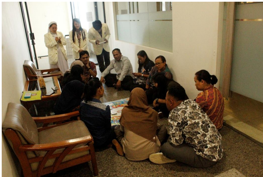
Gambar 3.7 Foto Game SEMAI

mendapat pertanyaan ketika sedang menengok teman di rumah sakit, aku melihat seorang ibu yang sedang mendorong anaknya dikursi roda sambil membawa tas besar. Aku menghampiri dan menawarkan untuk membantu membawakan tas tersebut. Apa yang aku lakukan sesuai dengan nilai...(kepedulian)