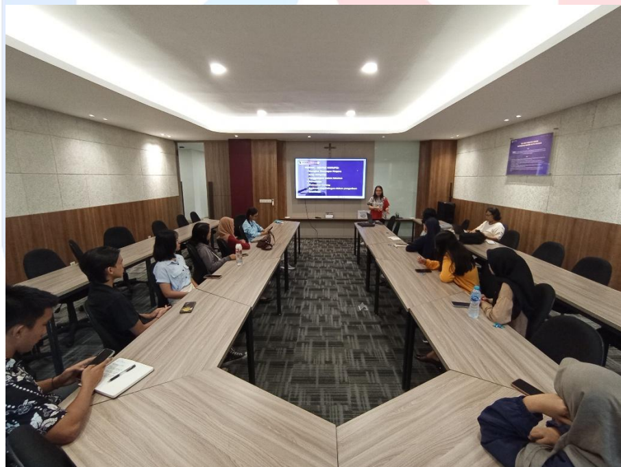
Gambar 3.2 Foto Pelatihan Tutor