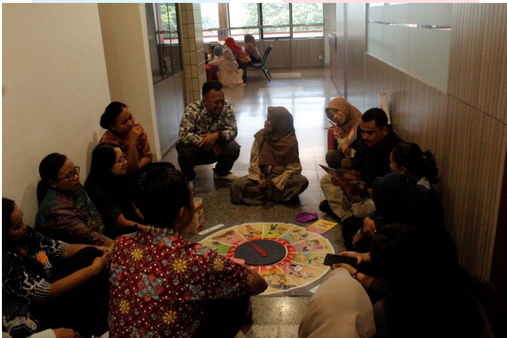
Gambar 3.8 Foto Game Put-put LK

Jawabannya seorang suami-isteri seharusnya menanyakan asal-usul uang atau barang yang diberikan kepadanya, terlebih lagi bila nilainya melampaui batas kewajiban penghasilan pasangannya. Bila pasangannya tidak mampu menjelaskan maka bisa dikatakan tindakan istri dan suami sebagai pencucian uang (TPPU). Pencucian uang adalah tindakan menyamarkan asal usul barang / harta yang diduga berasal dari hasil tindak pidana melalui kegiatan yang sah atau legal agar menghasilkan harta yang sah (pasal 1 angka 1 UU No. 8 tahun 2010).