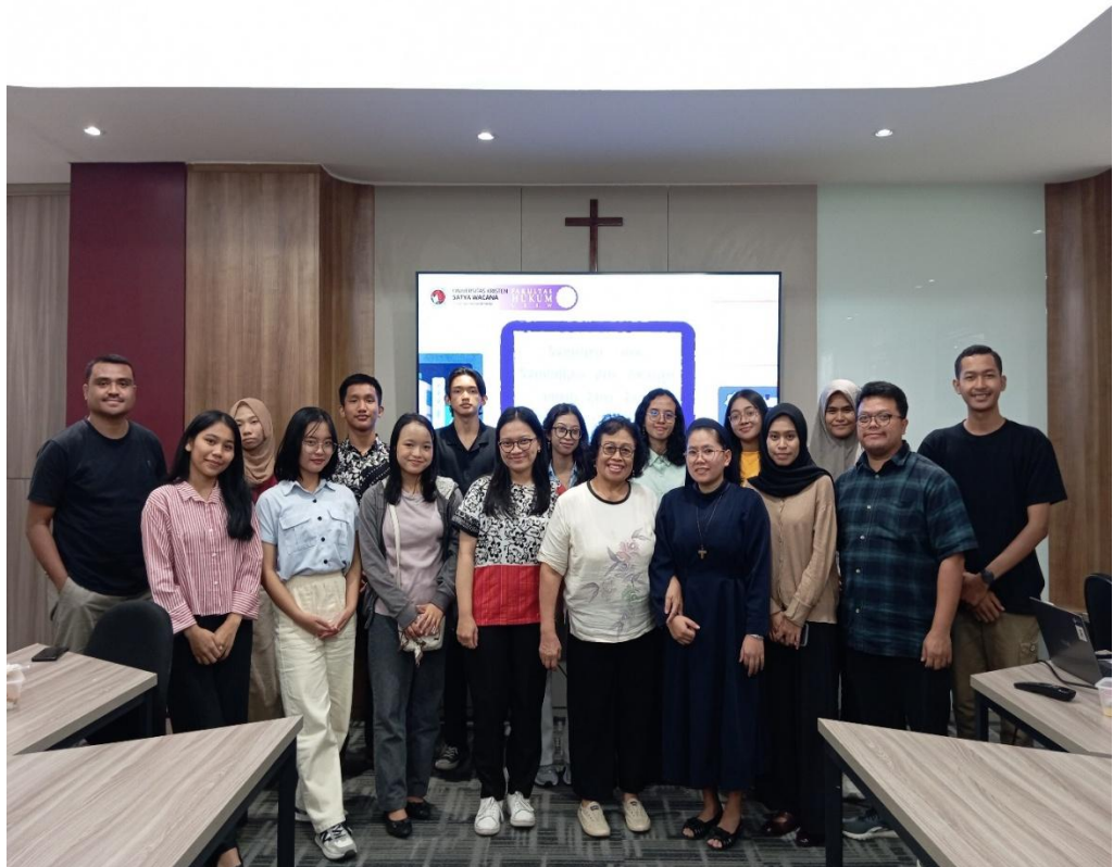
Gambar 3.3 Foto Pelatihan Tutor