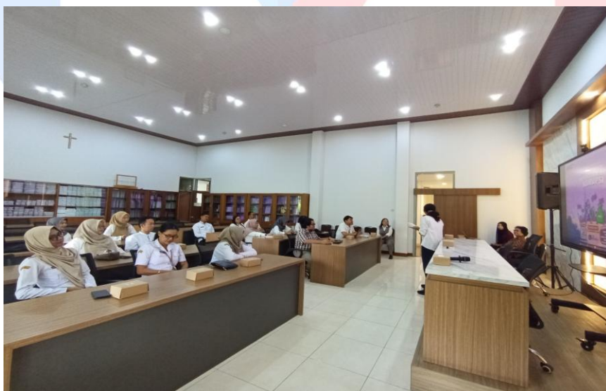
Gambar 2. Technical Meeting Peserta