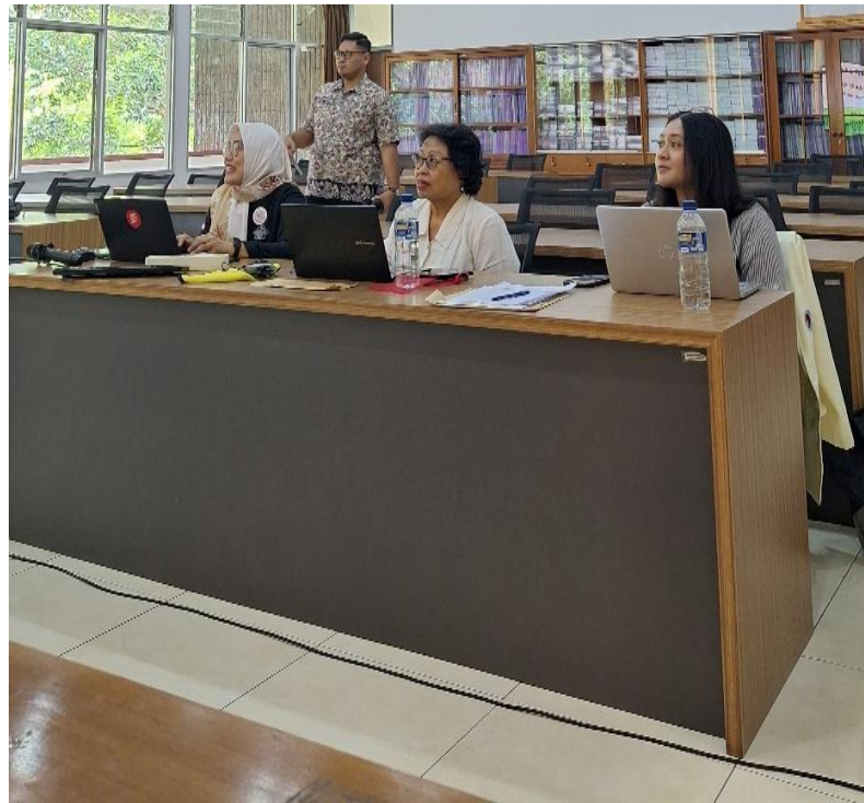
Gambar 3. Juri