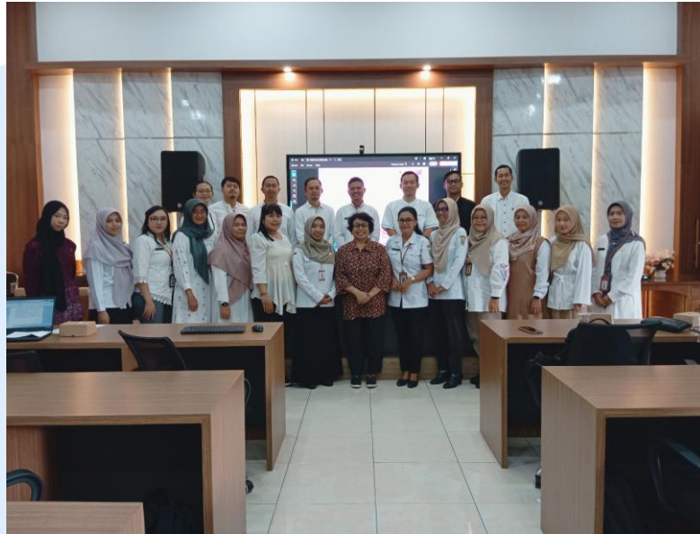
Gambar 1. Foto Peserta Lomba

Hasil seleksi administratif lomba game base learning menghasilkan 18 (delapan belas) peserta yang memenuhi persyaratan untuk melakukan presentasi di hari pelaksanaan lomba pada tanggal 23 Oktober 2025. Sehari sebelum pelaksanaan lomba game base learning ini didahului dengan pertemuan peserta yang memenuhi syarat tersebut dalam forum TM (teknical meeting). Dalam TM ini diberitahukan kepada peserta teknis pelaksanaan lomba, yang meliputi, hal-hal yang harus dikirim ke panitia untuk presentasi serta pengenalan tempat pelaksanaan.