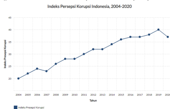
Gambar 2.1 Indeks Persepsi Korupsi Indonesia 2004-2020

Merujuk pada Corruption Perceptions Index , Indonesia menempati ranking 102 dari 180 negara dengan penilaian sebesar 37 dari 100 persen pada tahun 2020. Indonesia mengalami penurunan persepsi indeks korupsi dari tahun sebelumnya dimana Indonesia menempati peringkat 86 dengan indeks 40. Di Indonesia sendiri berdasarkan data yang dihimpun dari Sistem Database Pemasyarakatan (SDP), Direktorat Jenderal Pemasyarakatan (Ditjen PAS), dari tahanan dan narapidana per Maret 2020 sebanyak 270.445 orang, terdapat sekitar 0,7% atau sebanyak 1.906 narapidana khusus korupsi. Namun nyatanya, banyak kantor wilayah yang belum melaporkan jumlah tahanan narapidana korupsi pada Maret 2020. 5